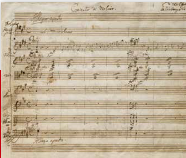
Autograf der ersten Seite von Mozarts Violinkonzert A-Dur

Das Konzert KV 211, die zweite Komposition dieser Serie, besticht durch sprühende Vitalität, die galante Atmosphäre und den einer wehmütigen Arie nachempfundenen, stark chromatischen Mittelsatz. Von italienischen Werken inspiriert ist sowohl die „neapolitanische“ Orchesterbesetzung mit zwei Oboen, zwei Hörnern und Streichern als auch das gleichermaßen kantable wie brillante Solospiel, das an die Schule Tartinis anknüpft. Auf französische Einflüsse gehen dagegen der forsche, von punktierten Rhythmen charakterisierte Kopfsatz sowie das abschließende improvisationsartige Rondeau zurück. Die in allen drei Sätzen immer wieder durchklin-